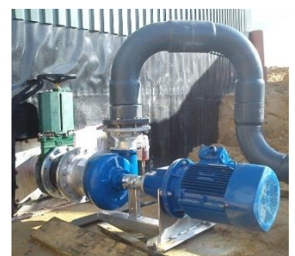
Trocken aufgestellte Dickstoff Gülpumpe

Sprechen Sie uns an! Wir beraten Sie gern.