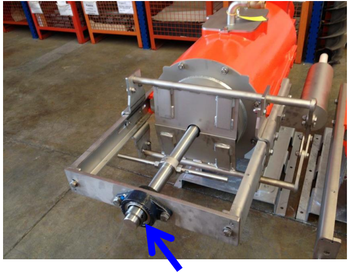
Vordere Lagerung ab Version Profi